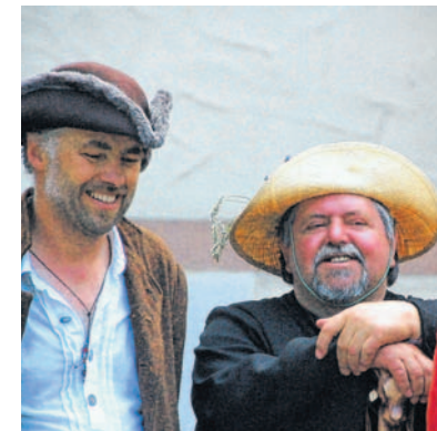
Auch ein „Pater“ war dabei.