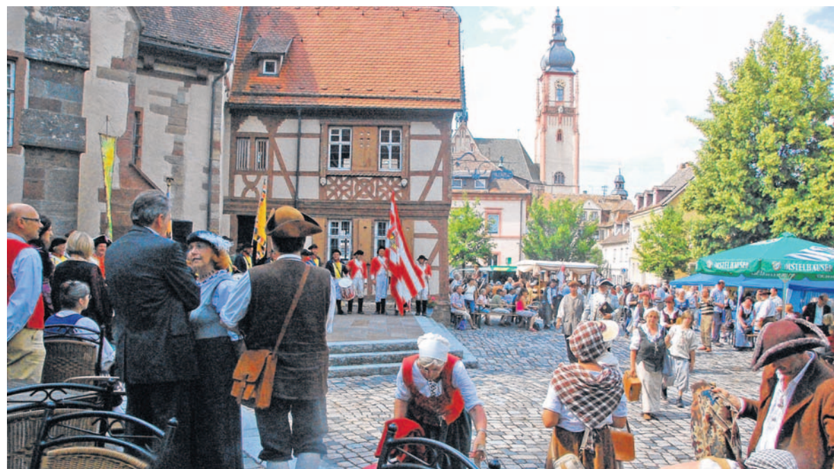
Eine schöne Kulisse bot der Schlossplatz sowohl dem Tross als auch den vielen Zaungästen.

Weitere Informationen über den Kaufmannszug gibt es unter www.kaufmannszug.de .