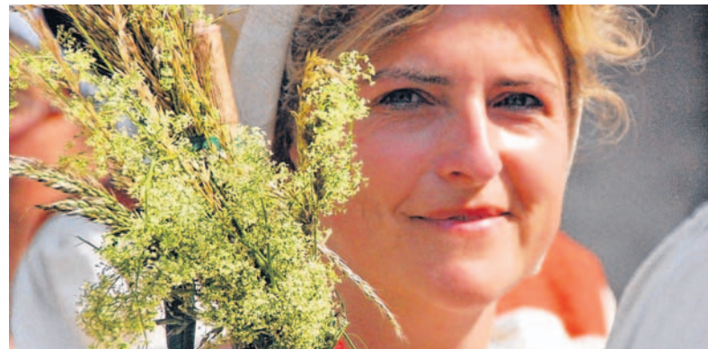
Marketenderinnen lieben ihren Charme spielen.